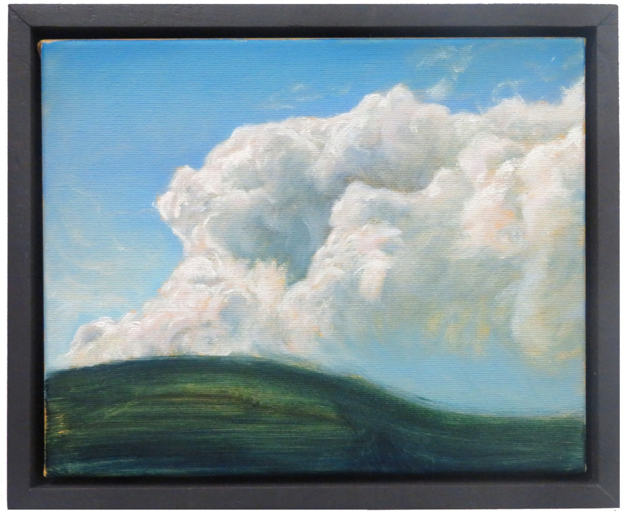
Storm , 2024 Oil on canvas 24 x 30 cm