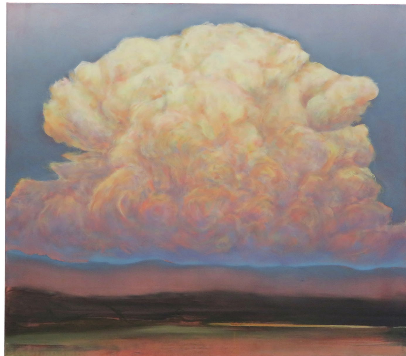
Cumulonimbus I , 2023, Oil on canvas, 130 x 150 cm