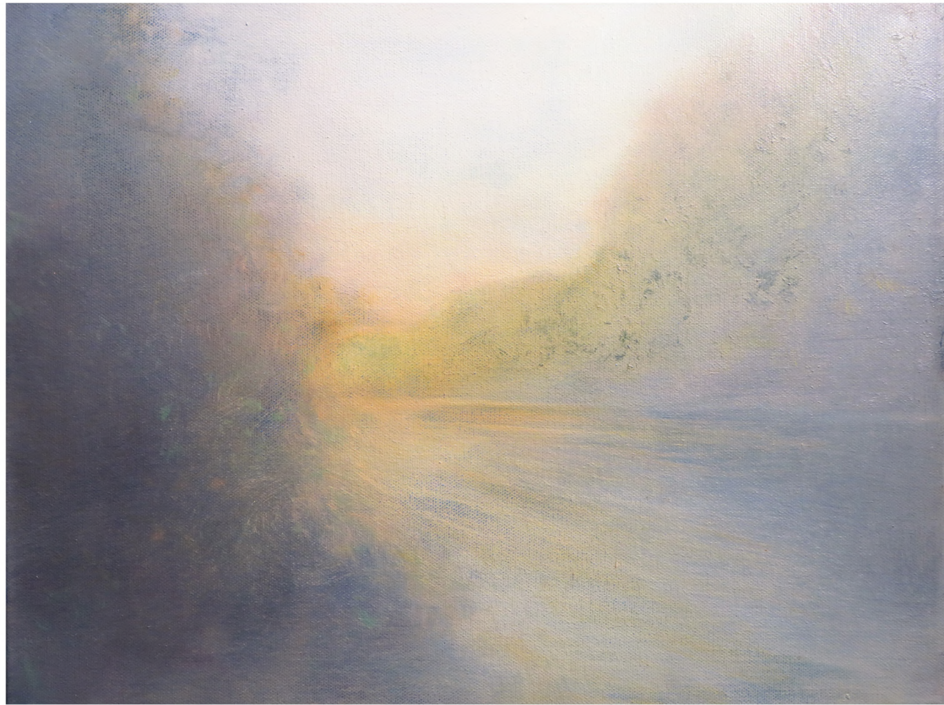
Aube Dorée , 2024 Oil on canvas 30 x 40 cm