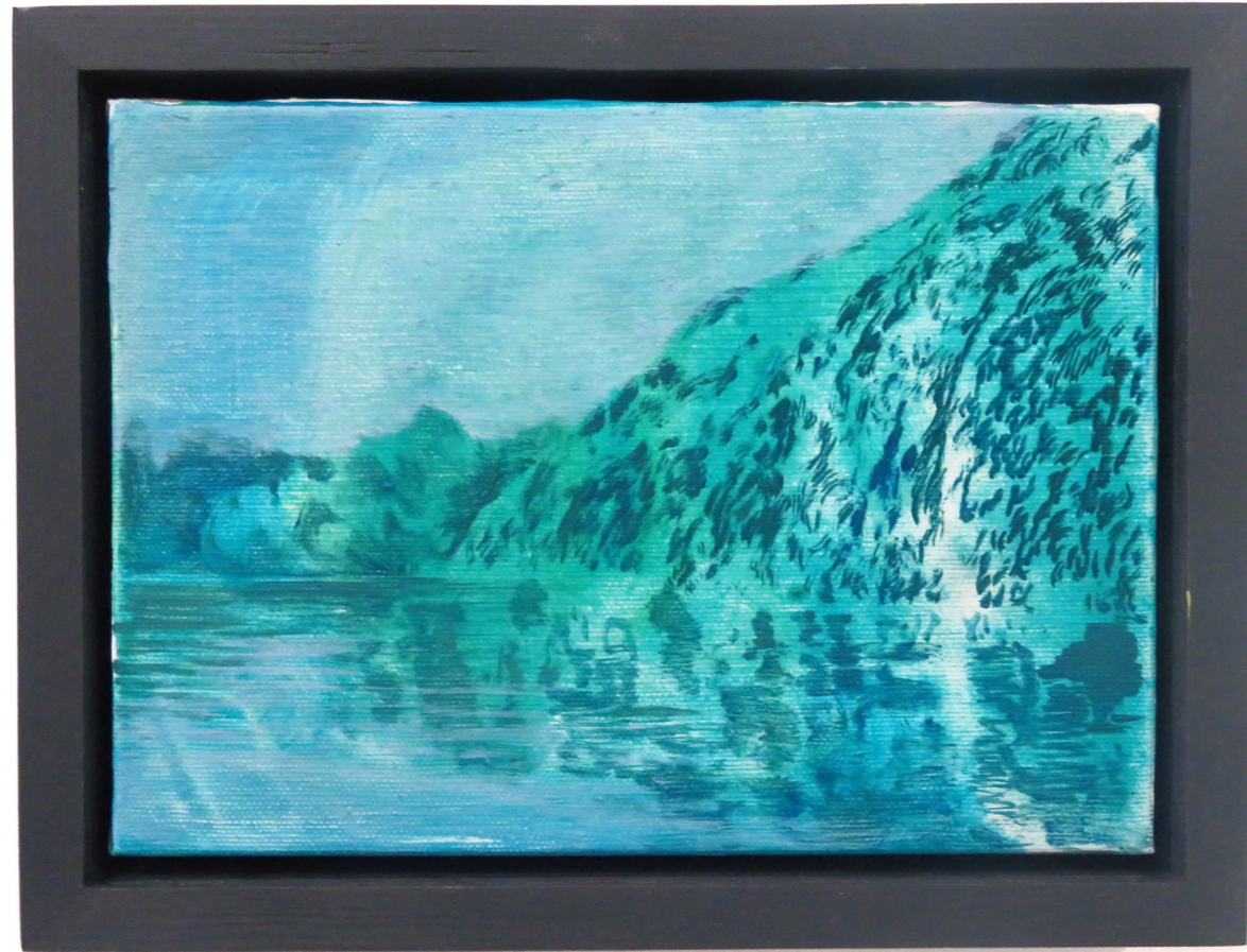
Gorges Bleues , 2024 Oil on canvas 16 x 22 cm