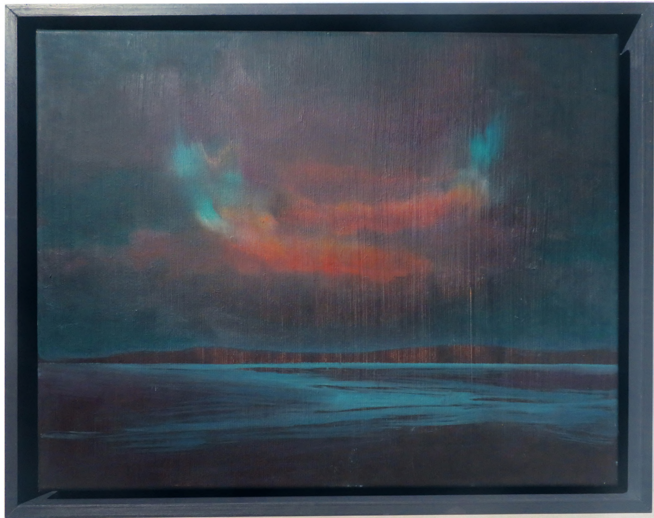
Boréale , 2024 Oil on canvas 40 x 50 cm