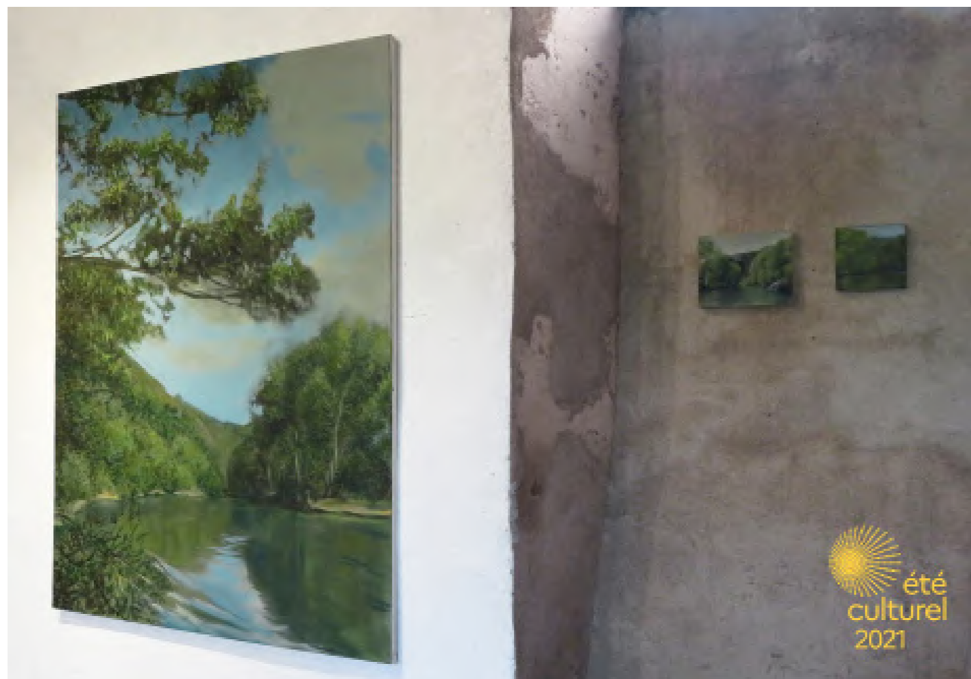
Vues d'exposition: SOLO SHOW «L'indifférence des oiseaux» Abbaye de Pébrac, été 2021