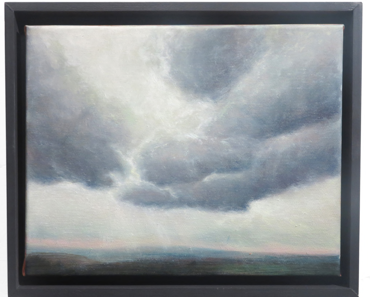
Percée , 2023 Oil on canvas 24 x 30 cm