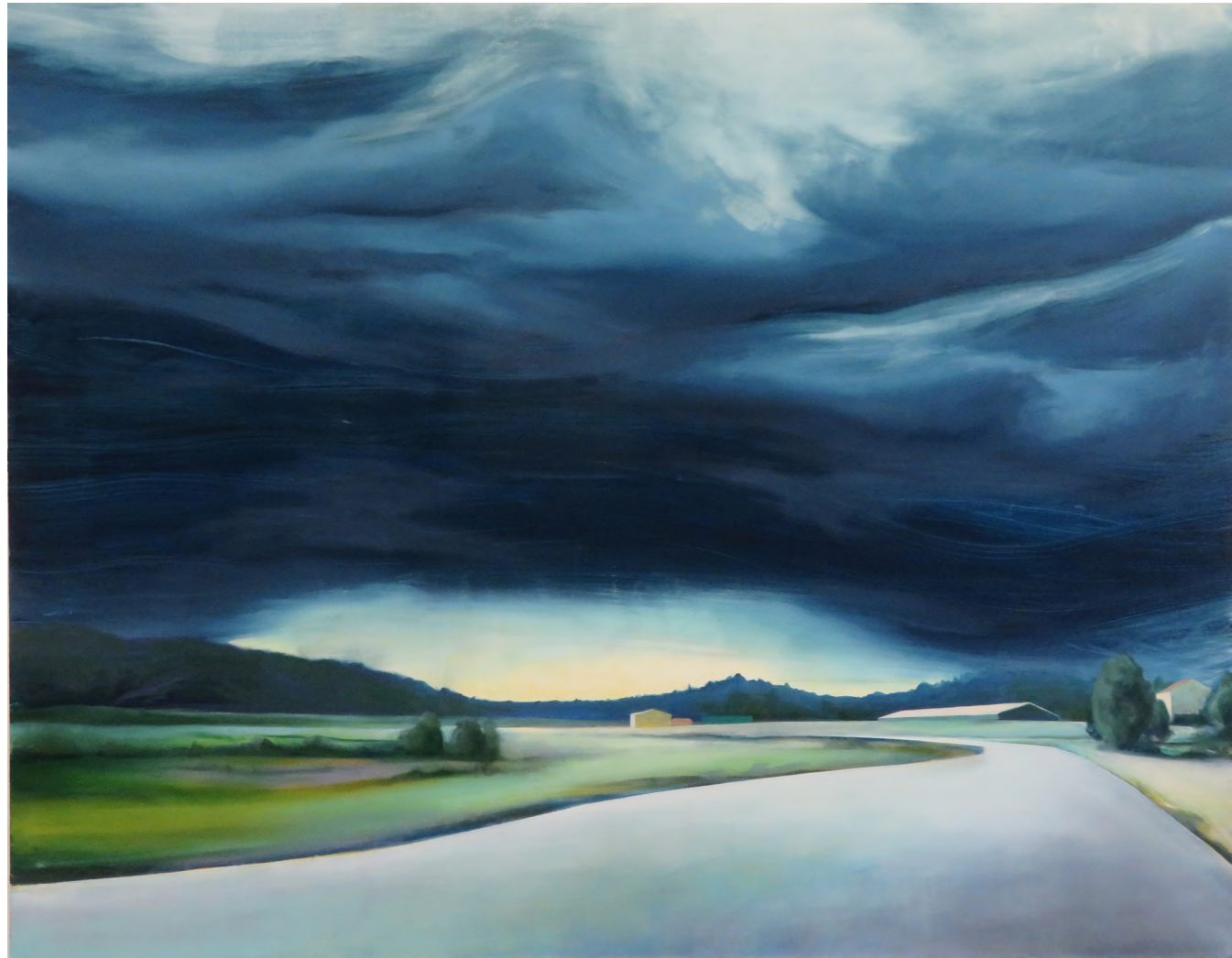
Road to Another World, 2020 Oil on canvas 180 x 200 cm