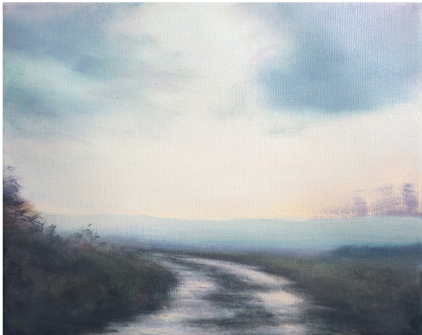
Waterlight , 2024 Oil on canvas 24 x 30 cm