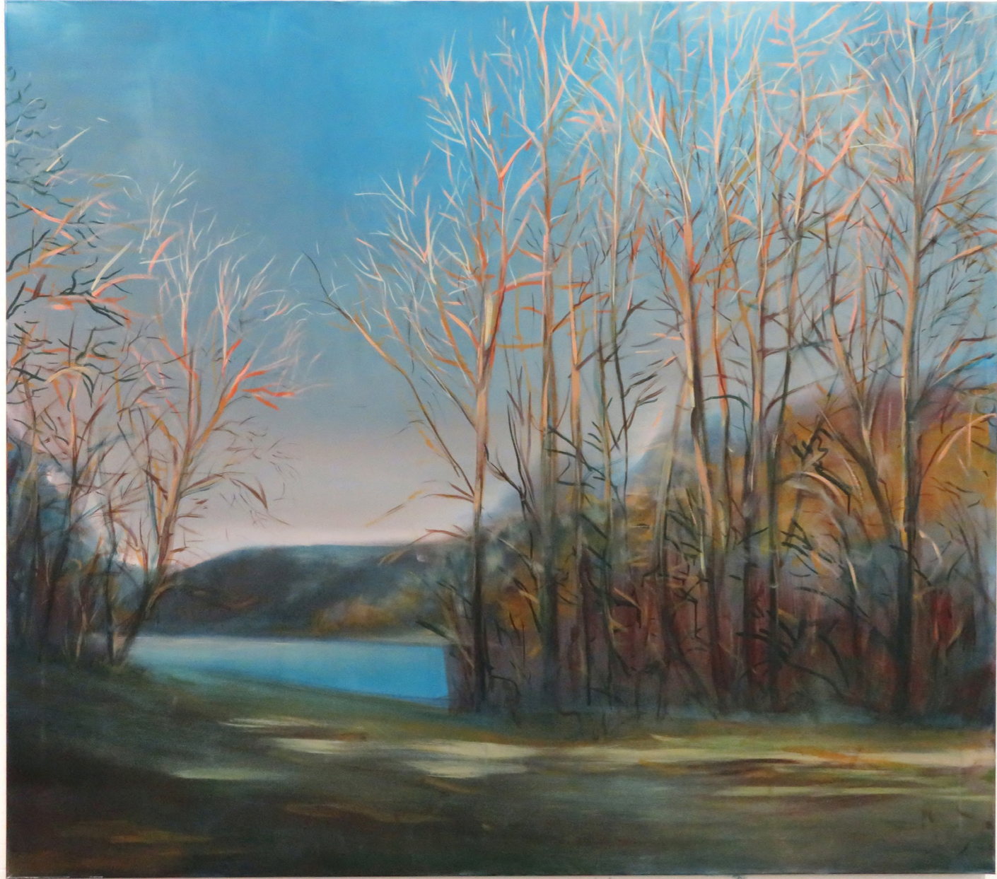
The Demiurge Scenery, 2023 Oil on canvas, 140 x 160 cm