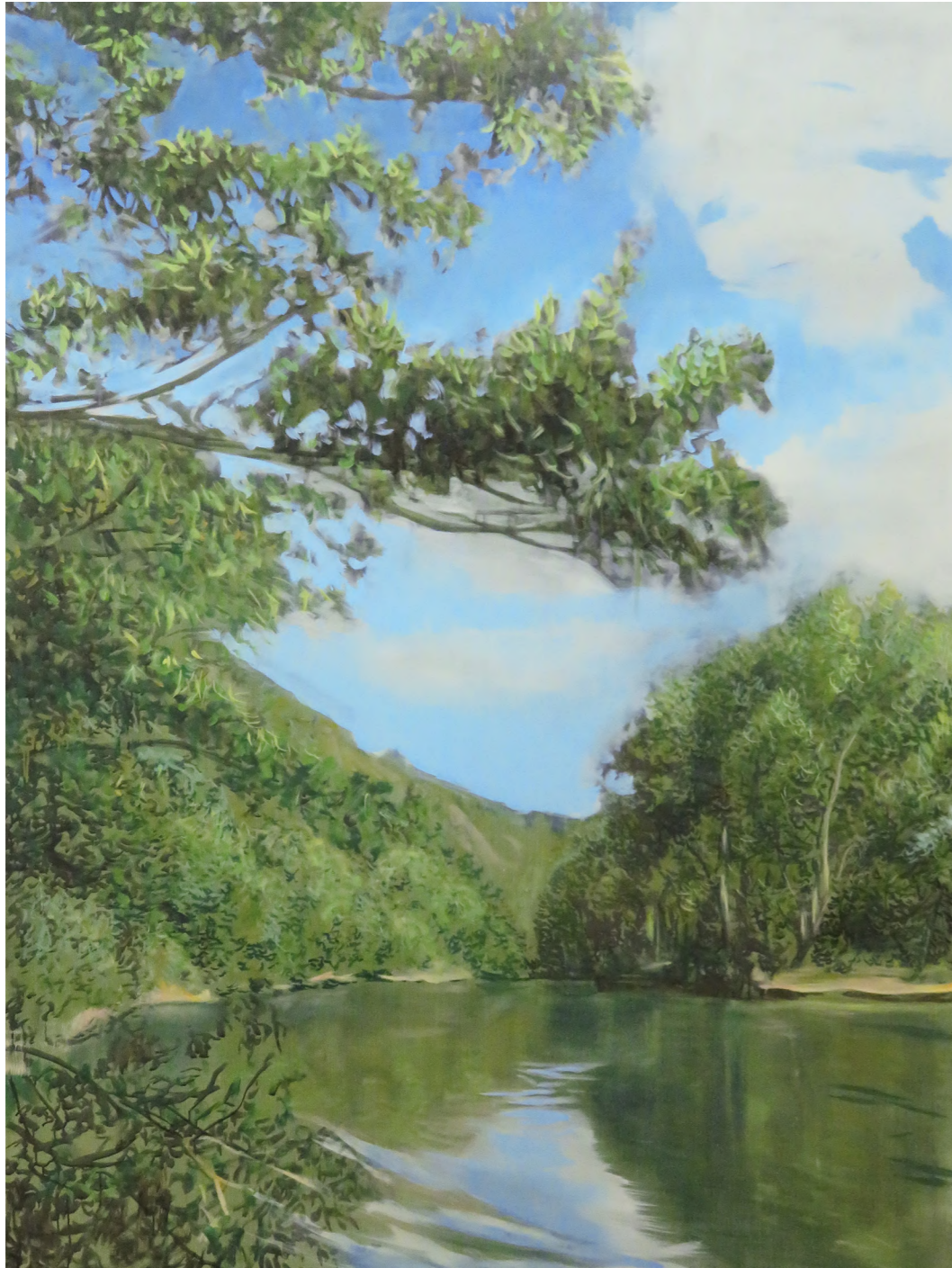
Paraiso Verde , 2021 Oil on canvas 140 x 180 cm