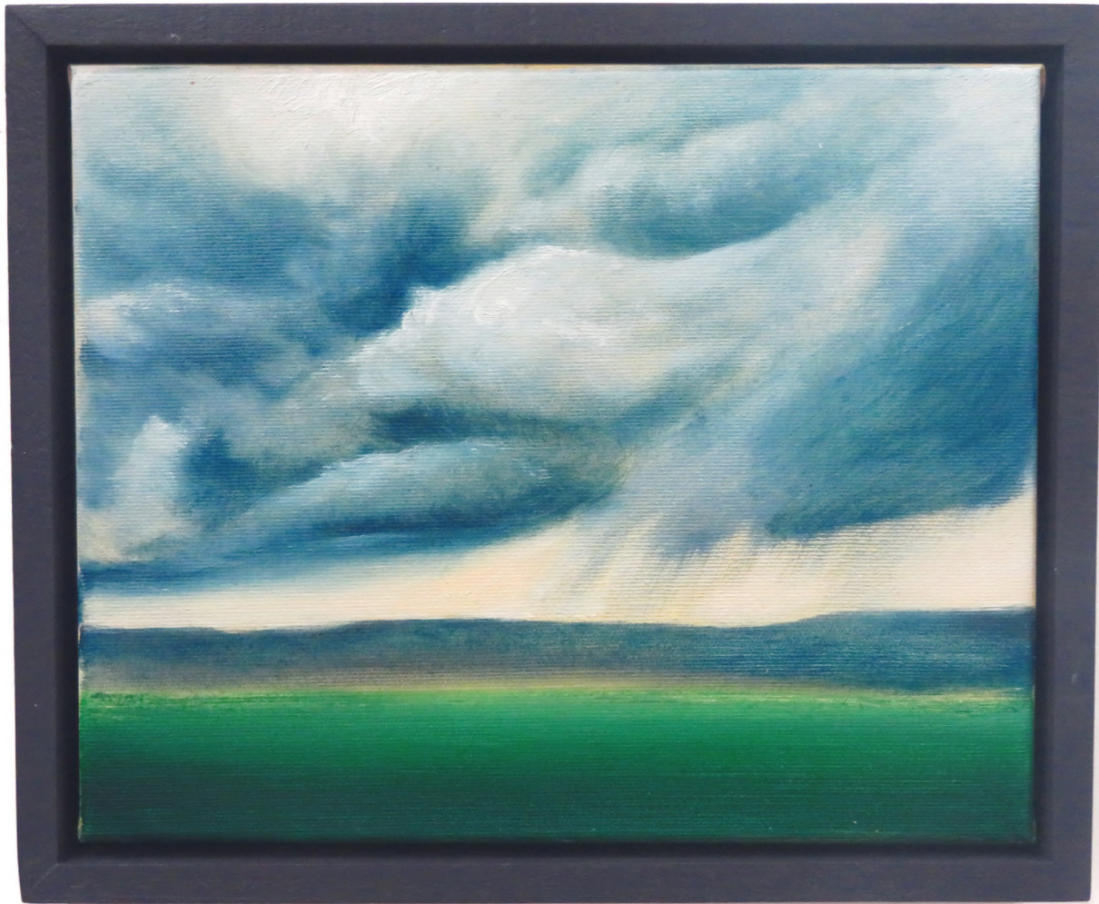
Pluie , 2024 Oil on canvas 24 x 30 cm