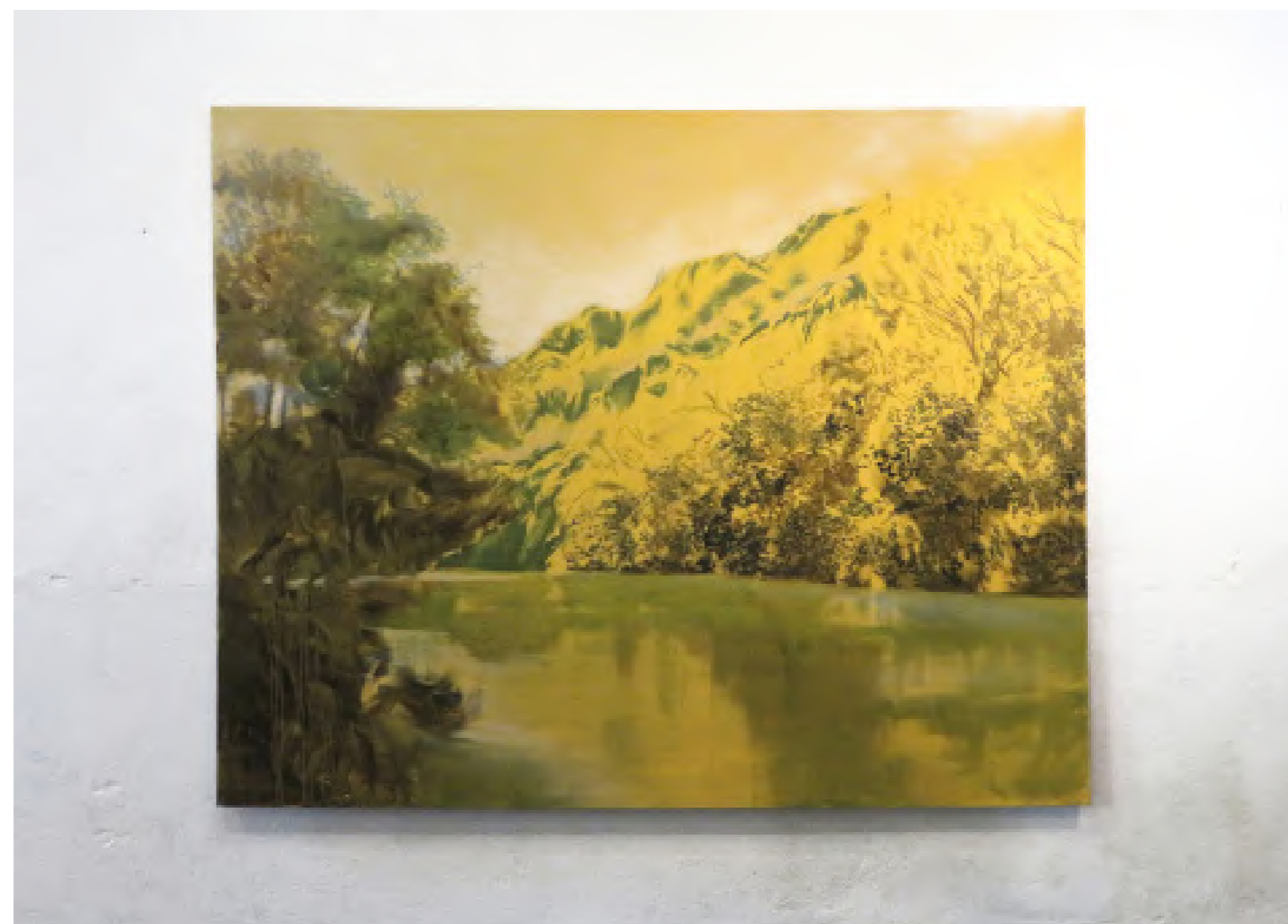
À gauche: Paraiso Verde , 2021, huile sur toile, 140 x 180 cm Ci-contre: Plein Soleil , 2021, huile sur toile, 200 x 250 cm