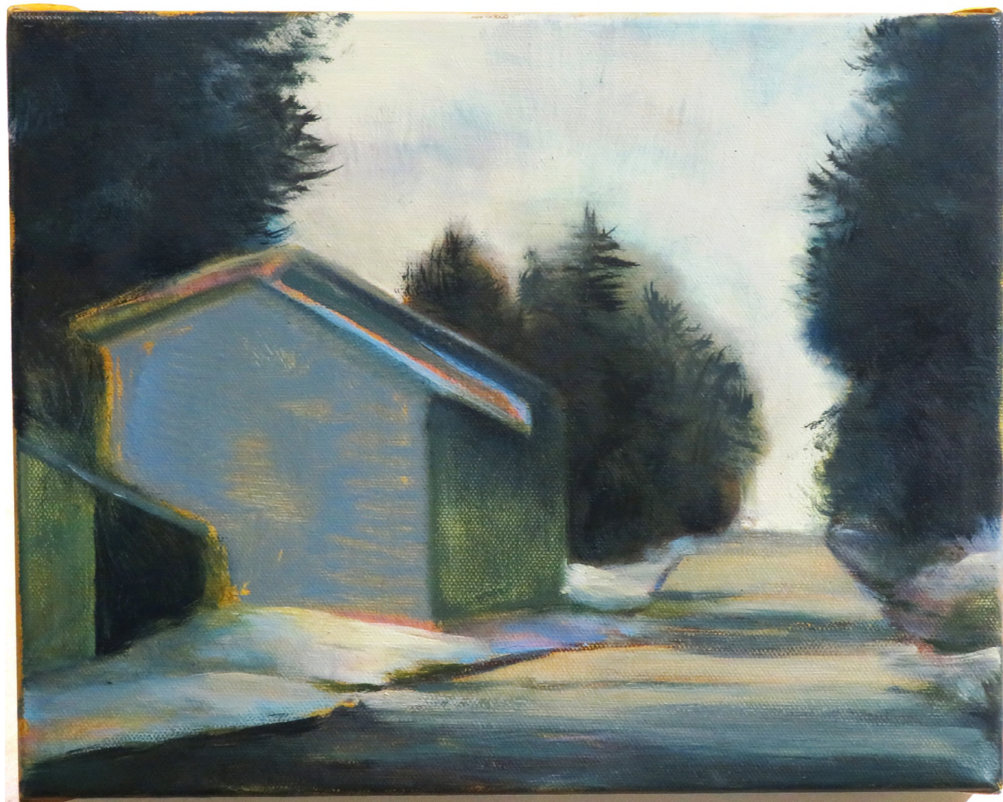
Suspens , 2023 Oil on canvas 24 x 30 cm