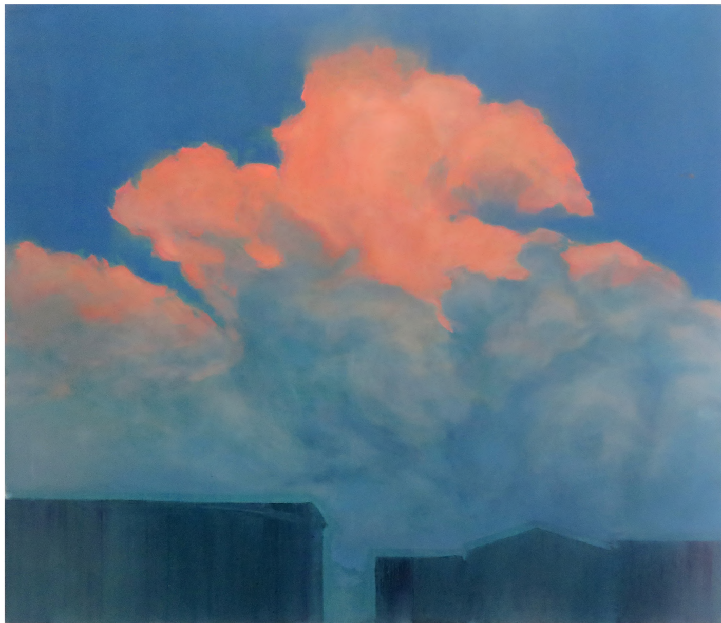
Cumulonimbus II , 2024, Oil on canvas, 130 x 150 cm