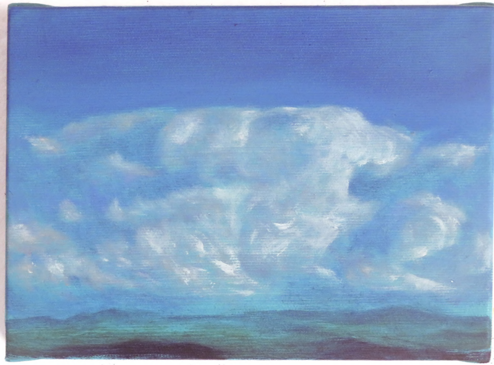
Opal Sky , 2024 Oil on canvas 16 x 22 cm