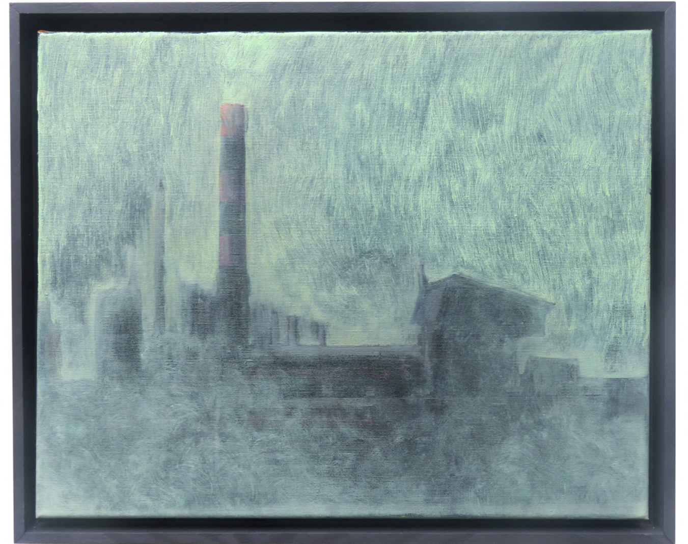
Raffinerie II , 2024 Oil on canvas 40 x 50 cm