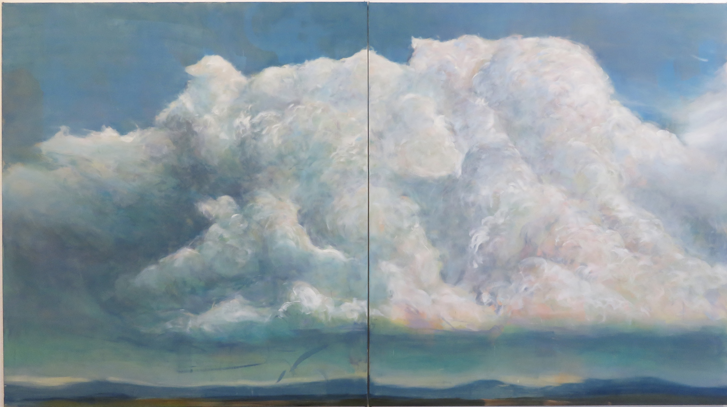
Cumulonimbus III, 2024 Oil on canvas, 200 x 360 cm