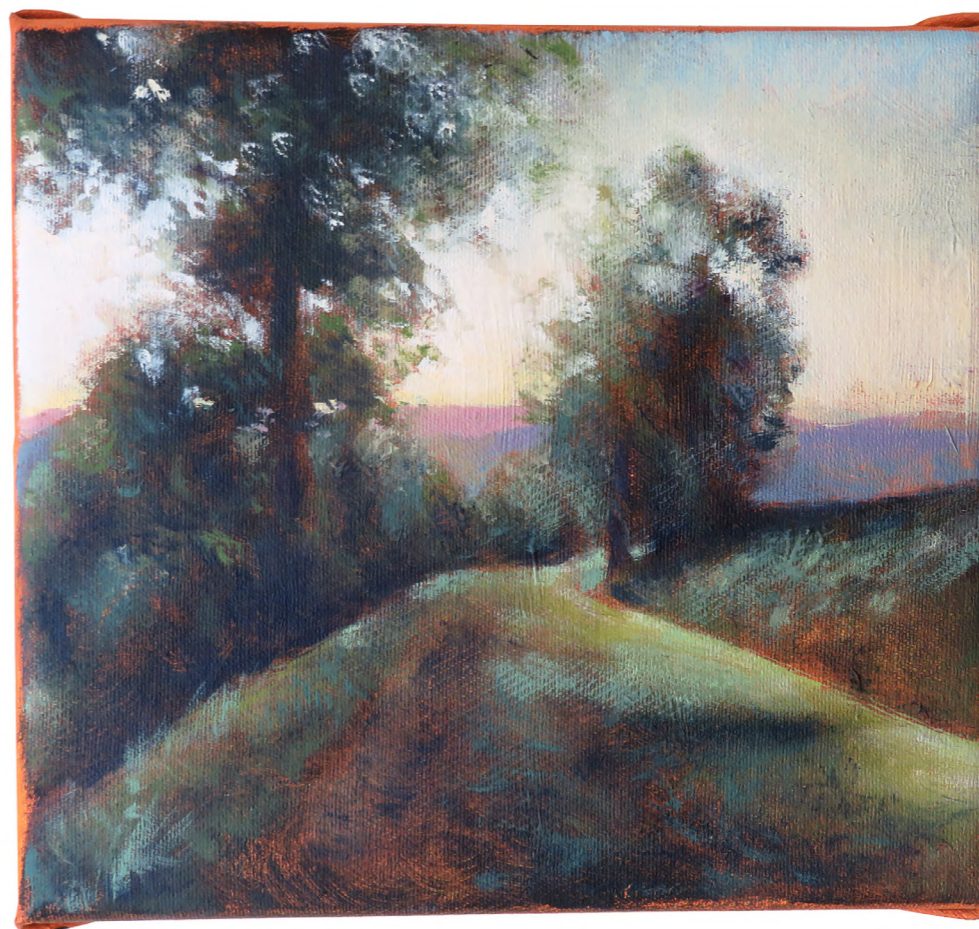
Sentier , 2023 Oil on canvas 19 x 20 cm