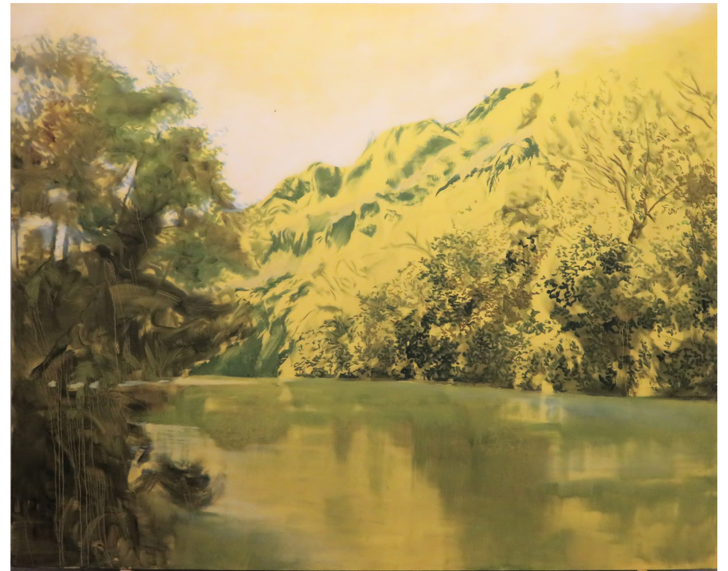
Plein Soleil , 2021 Oil on canvas 200 x 250 cm