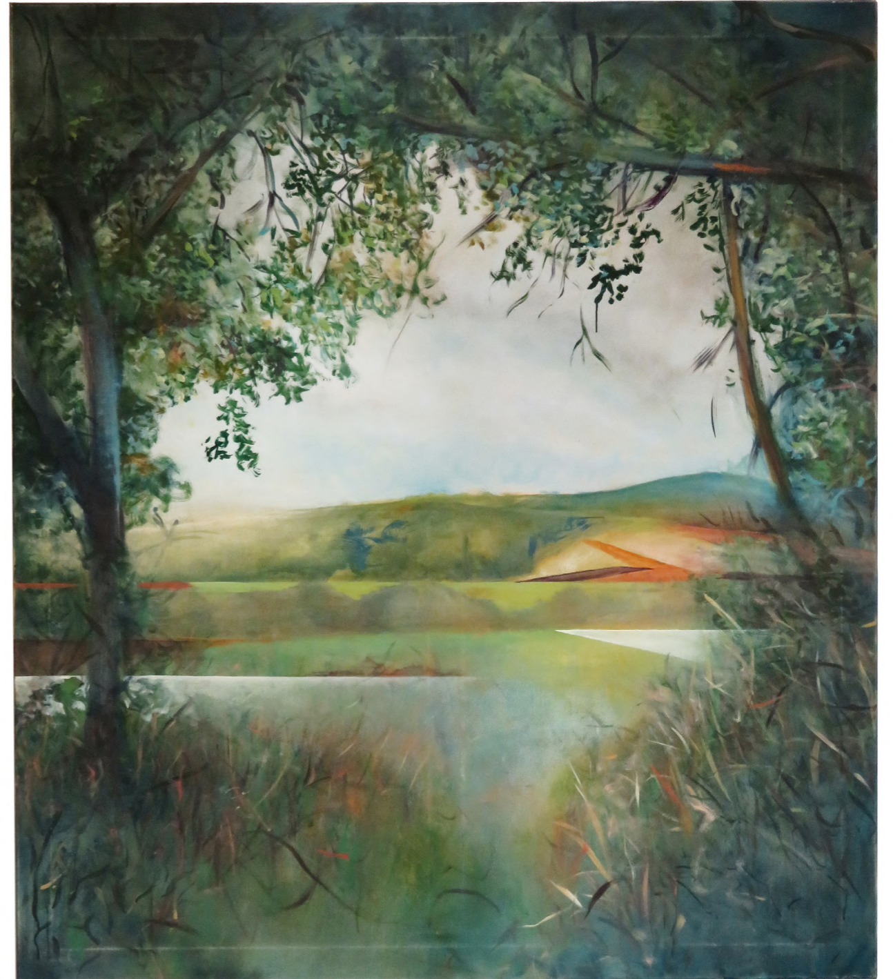
Arcade , 2023 Oil on canvas 150 x 170 cm