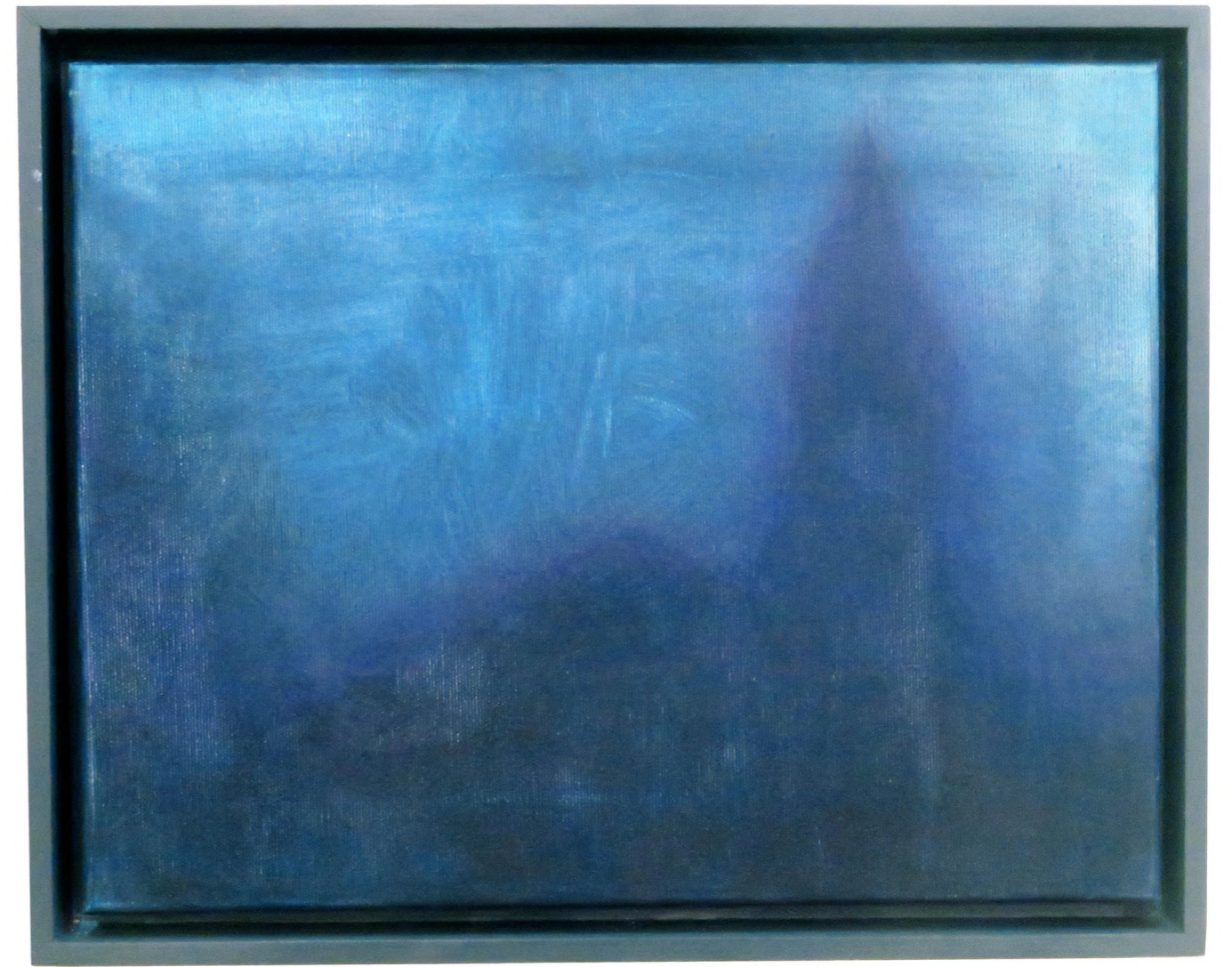
Fantôme , 2024 Oil on canvas 30 x 40 cm