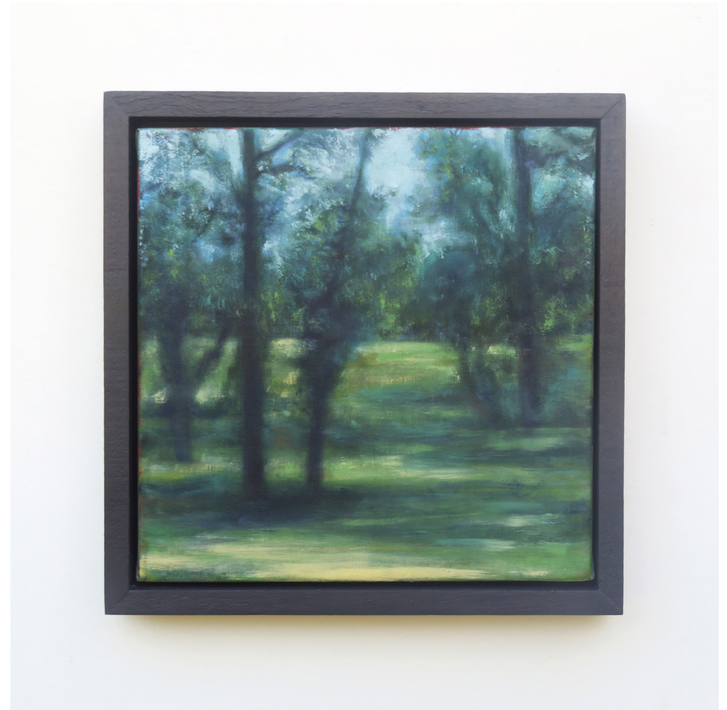
Derrière la vitre, 2024 Oil on canvas 24 x 24 cm