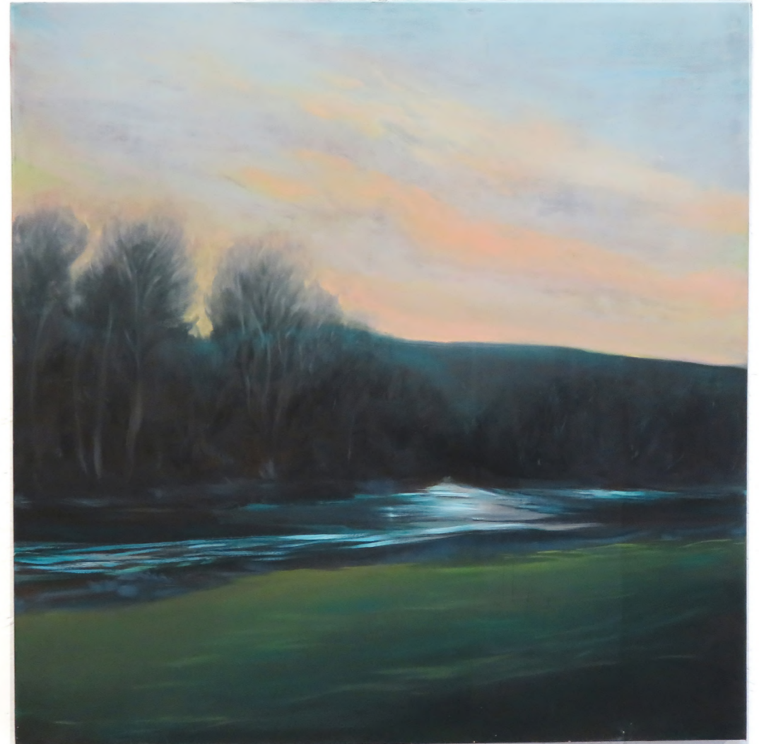
Derrière les Arbres, la Nuit, 2020-2022 Oil on canvas 100 x 100 cm