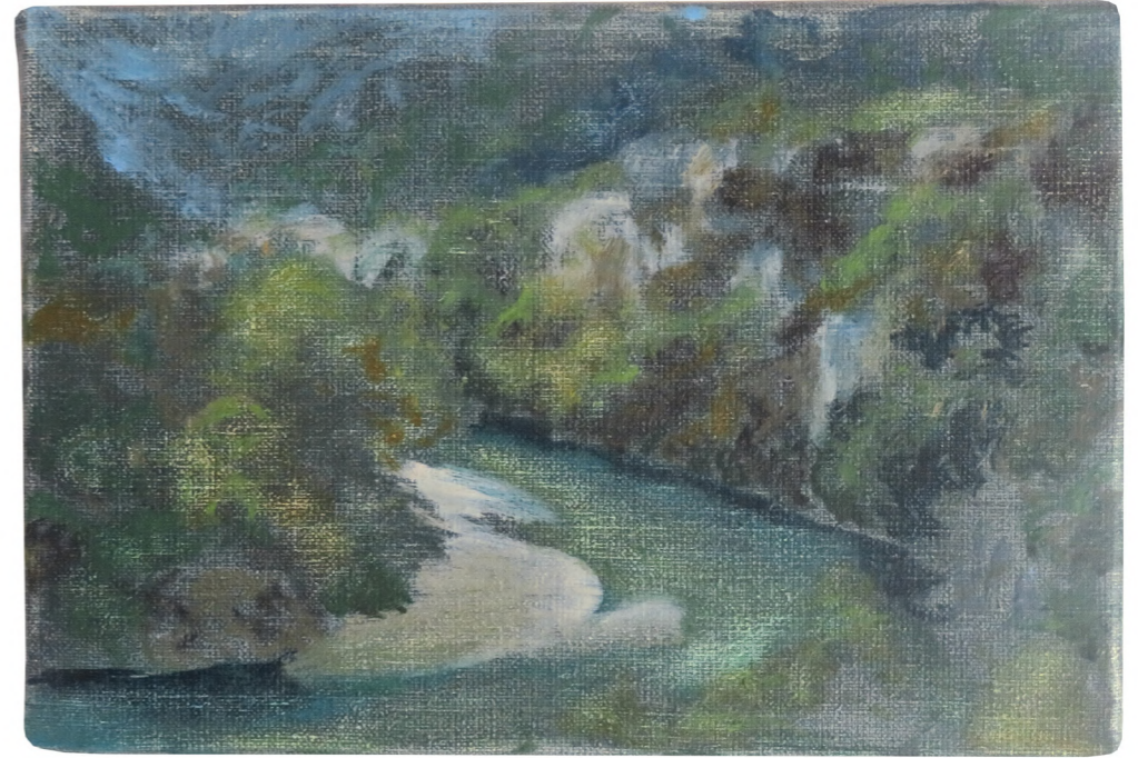
Gorges, 2024 Oil on canvas 16 x 24 cm