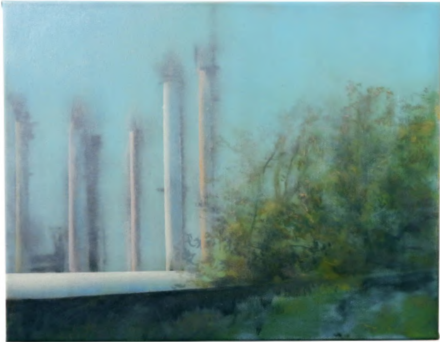
Raffinerie, 2023 Oil on canvas 30 x 40 cm